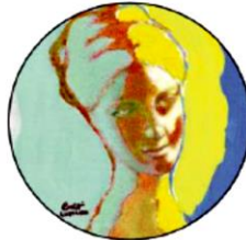
Pietro Lumachi "La dolcezza della vita" 2014