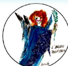
Emanuele Luzzati "La forza della pace" 2010 e.s.