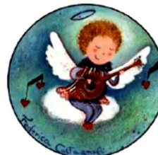
Federica Castagnoli "Angelo della musica" 2015