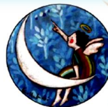
Carlotta Castelnovi "Il senso della vita" 2011