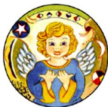
Gigi degli Abbati "Il gioco della prevenzione" 2013