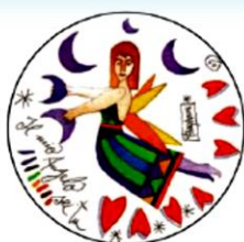
Francesco Musante "La magia dei colori" 2009